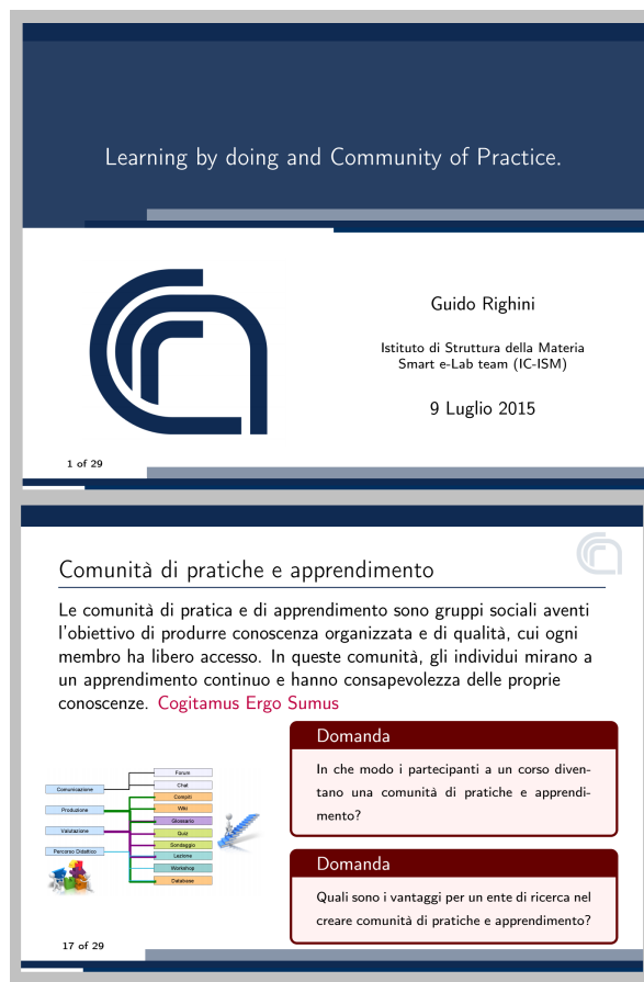
Fig. 2 Esempio di Presentazione realizzata con LaTeX e Beamer.