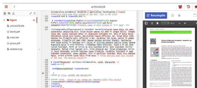
Fig. 1 Area di lavoro per la scrittura del documento con sharelatex.

I comandi \begin{document} e \end{document} racchiudono il testo del documento. In caso di testi molto lunghi è sempre possibile suddividere il testo in più file e collegarli con il file principale con il comando \include{nomefile} . Altro vantaggio del programma è la gestione dei riferimenti bibliografici. Attraverso un semplice editor di testo si può creare un file bibtex (ad esempio bibliografia.bib ), contenente tutte le nostre citazioni bibliografiche, aggiungendo ad esempio il testo esportato dal sito dell'editore della rivista o da google scholar. Qui di seguito un esempio di citazione bibliografica in formato bibtex: